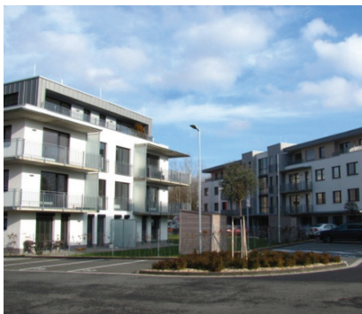
Residence Na Plachtě I. etapa, Hradec Králové