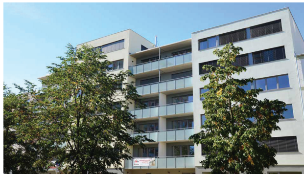
BD Residence Hronovická, Pardubice