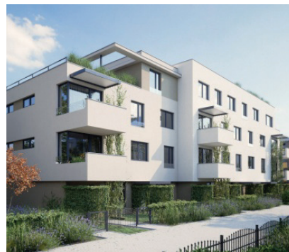
BD Ve Stromovce, Hradec Králové