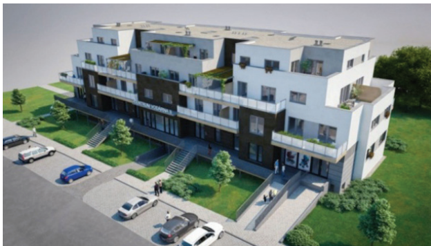
BD Centrum Vodárna II, Kolín